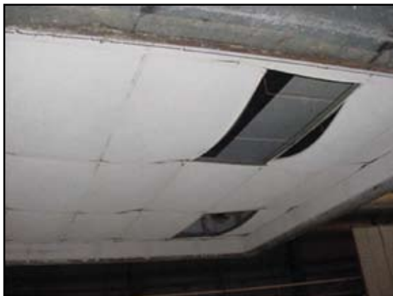
Foto – Verlaagd plafondstelsel na afloop van de brandproef.